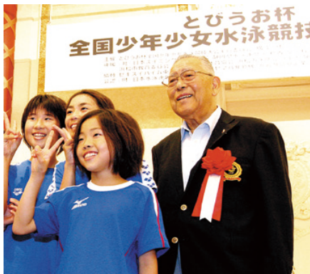
子どもたちと笑顔でふれあう古橋さん(2008年)

1928年静岡県浜名郡雄踏町（現浜松市）に生まれ、小学4年生から水泳をはじめ。1948年に日本が参加できなかったロンドン五輪と同時期に開催された日本選手権で出した世界記録が同五輪優勝タイムを大幅に上回り、「フジヤマのトビウオ」の名が世界中に知れ渡った。日本水泳連盟名誉会長や日本オリンピック委員会会長を歴任し、日本スポーツ界に貢献。2008年にはスポーツ競技者として初の文化勲章を受章した。2009年、世界選手権開催中のイタリア・ローマで逝去。享年80歳。